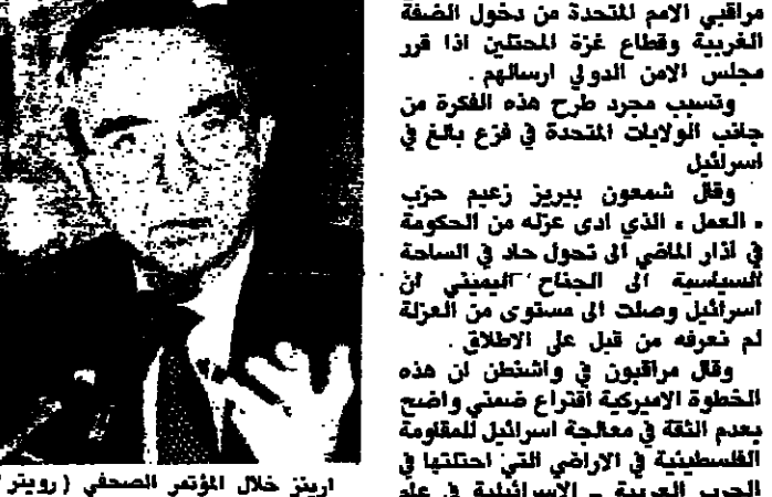
اريتز خلال المؤتمر الصحفي

قلت اسرائيل امس انها ستستمر مرافقة الامم للتحقق من دخول الضفة الغربية وقطاع غزة المحتل اذا قرر مجلس الامن الدولي ارساله. وتوسد مجرد طرح هذه الفكرة من جانب الولايات المتحدة في فرع باغ في اسرائيل. وقال شمعون بيريز زعيم حزب العمل الذي ادى عزه الى الحكومة في اذار الماضي ان تحول حد في الساحة السياسية الى الجناح اليميني ان اسرائيل وصلت الى مستوى من العزلة لم تعرفه من قبل في الاطلاق. وقال مراقبون في واشنطن ان هذه الخطوة الاميركية اقترحت ضمنيا واضع يخدم الثقة في معالجة اسرائيل للقضية الفلسطينية في الاراضي التي احتلتها في الحرب العربية - الاسرائيلية في عام ١٩٦٧. وقالت القوات الاسرائيلية واقتربت القوات الفلسطينية بالقرب من بئرصاص صيدا فلسطينيا بالقرب من رام الله بغضبة الغريبة المحتلة امس. ورغم التشكيك في ظروف قتله فقد كانت الظروف هي نفس ما تحدث عنه الرئيس الاميركي جورج بوش في مؤتمر صحفي في واشنطن حيث قال تزعمى خسارة ارواح البشر - والفكر بوجه خاص في الاطلاق. وعقد وزير الخارجية الاسرائيلي موشى ارينز مؤتمرا صحفيا لاجراءات من اقتراع حكومته وقال اسرائيل ان كابل مراقبين من الامم المتحدة في الاراضي التي تسيطر عليها اسرائيل. وقال ارينز اولئك الذين يحرضون بوش عن العمل العنفي سيحرضون بنسج على الاضرار في مزيد من اعمال العنف.